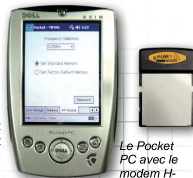
Le Pocket PC avec le modem H-Link

Les caractéristiques du MFS lui permettent de faire fonctionner en même temps plusieurs émetteurs qui partagent la même fréquence sur un même site. Par conséquent, les opérateurs n'ont pas à s'occuper de la gestion des fréquences.