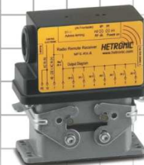
Récepteur MFSHL RX-AC8