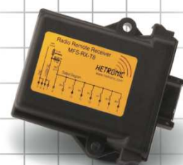
MFSHL RX-T8 Empfänger