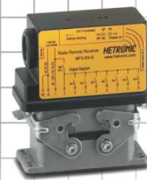
MFSHL RX-T8 Empfänger