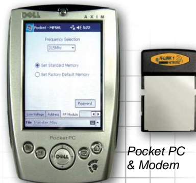
Pocket PC & Modem

Mit MFS ist eine Bedienung von bis zu 20 Sendern mit derselben Frequenz in näherer Umgebung möglich. Das heisst dass sich Bediener keine Gedanken über die Frequenzeinstellung machen müssen.